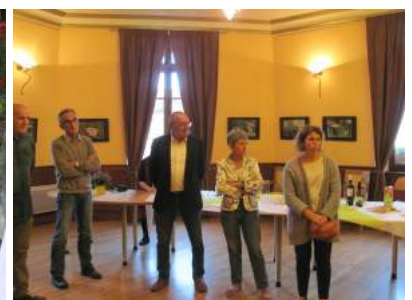
Vernissage de l'exposition photo "Dénaturée" et sculpture en pneus recyclés

avec ta planète » (voir notre précédent numéro pour un résumé de ces actions).