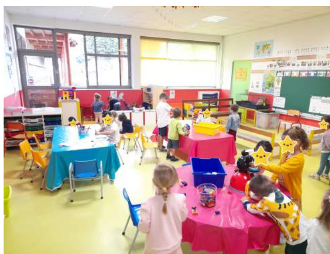
Les classes de CE2-CM2 et TPS-PS-MS-GS le jour de la rentrée