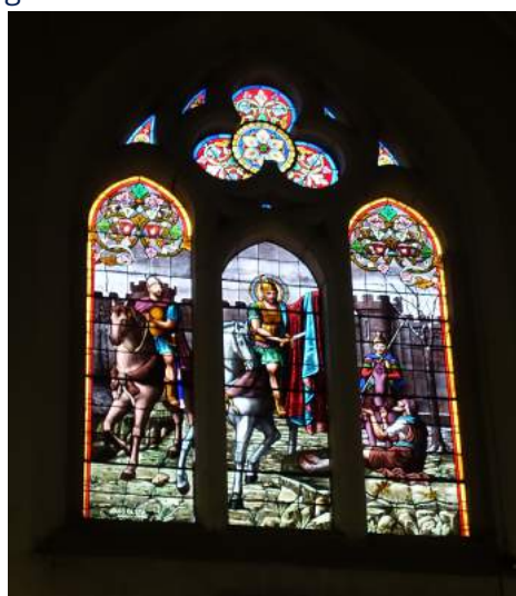
Vitraux de l'église Saint-Martin déposés pour restauration

Si vous souhaitez participer à la restauration des vitraux, une campagne de don est ouverte. Vous en trouverez le détail dans le flyer disponible à l'accueil de la mairie ou sur le site https://www.fondation-patrimoine.org