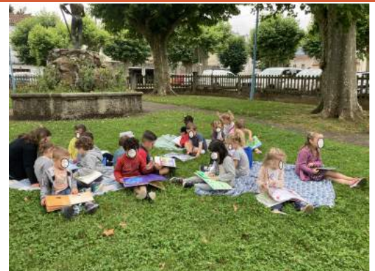
Les petits lecteurs dans l'herbe au square du Faucheur le 29 juin dernier