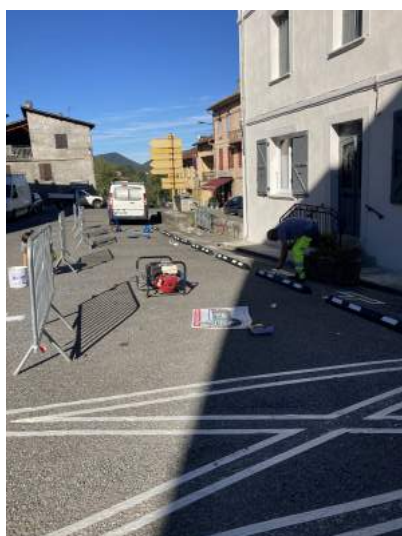
Mise en place des butées normalisées et traçage de la signalétique horizontale par les services techniques