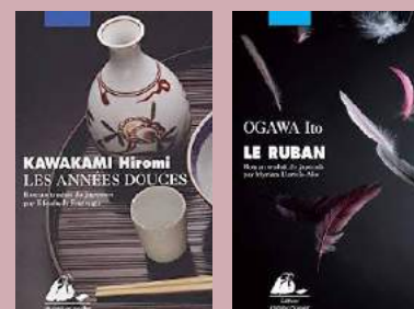
Livres présentés lors de la prochaine séance du club de lecture

Des informations plus détaillées sur cette animation seront développées dans le prochain numéro des Nouvelles Brèves.