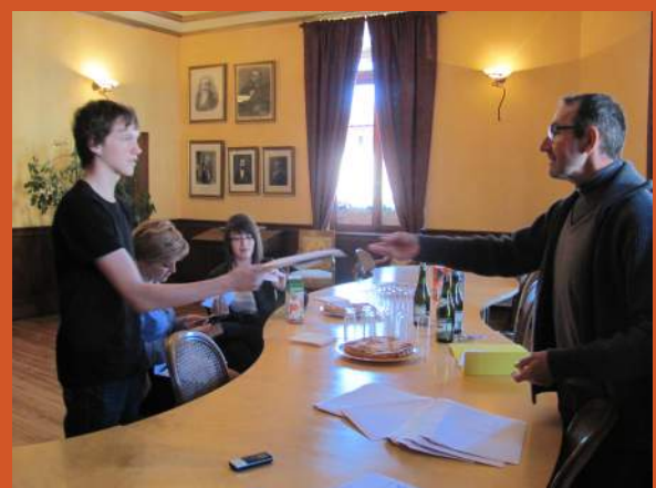
La remise du diplôme aux nouveaux électeurs